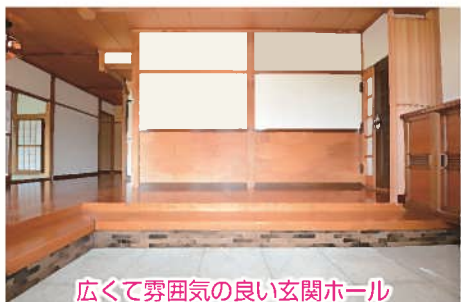
広くて雰囲気の良い玄関ホール

頭金 0 円 980 万円の返済例 月々36,163 円 ボーナス払い 0 円 返済期間/25年 ※金利0.825% 変動金利型・25年返済(均等)の場合。 ※審査結果によってはご希望に添えない場合があります。 ※このシミュレーションは手数料、諸経費は含まれておりません。 ※この記載の返済例は、令和元年8月1日現在のものです。金利情勢の変化などにより変わる場合があります。 ※実際のローンのお申込みに際して審査が必要です。