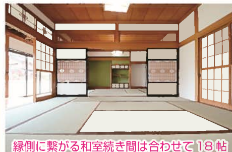
縁側に繋がる和室続き間は合わせて18帖