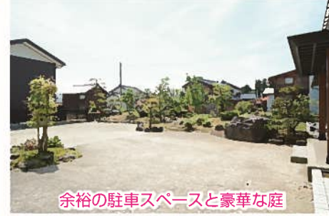
余裕の駐車スペースと豪華な庭