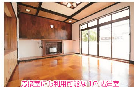
応接室にも利用可能な10帖洋室