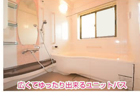
広くてゆったり出来るユニットバス