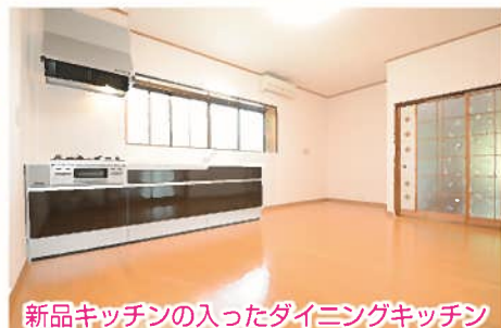
新品キッチンが入ったダイニングキッチン