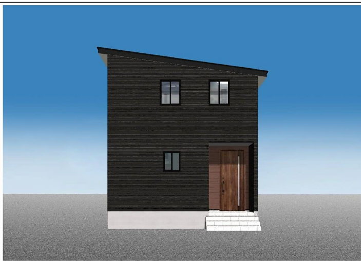
カーナビ検索: 三条市鶴田4丁目7-1