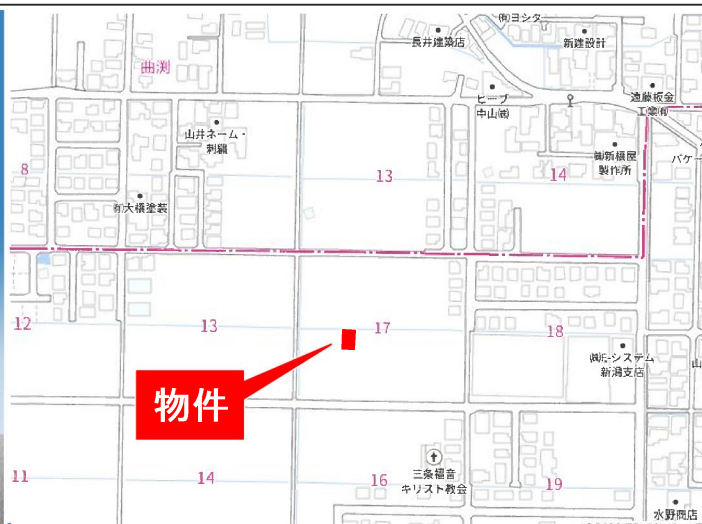
カーナビ検索：三条市曲淵3丁目17付近