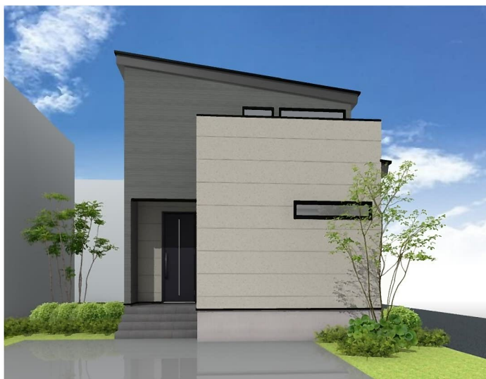
カーナビ検索:長岡市新保5丁目9-9付近