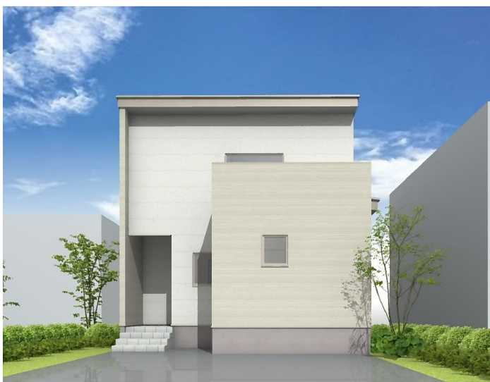
カーナビ検索：長岡市新保5丁目9-9付近