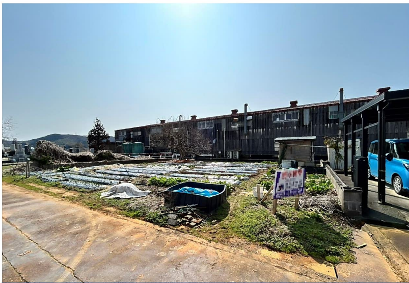
カーナビ検索：見附市月見台1丁目4-40-2付近