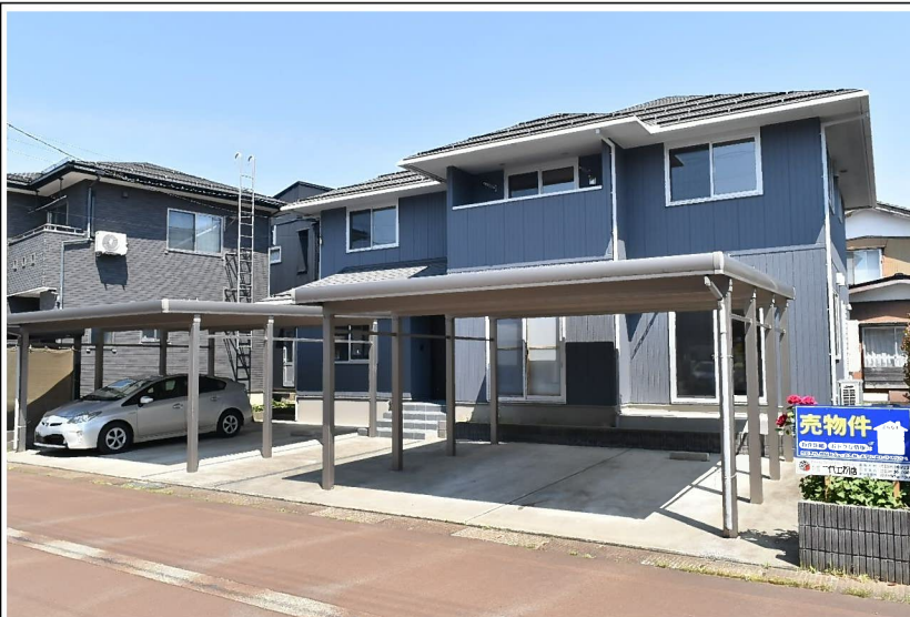
カーナビ検索:長岡市悠久町4丁目22番地